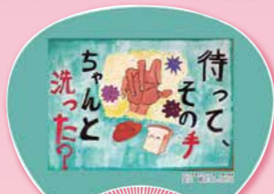
B 大阪市長賞 金沢 晴花さんの作品