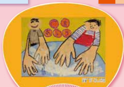
C 堺市長賞 渡邊 巧一さんの作品