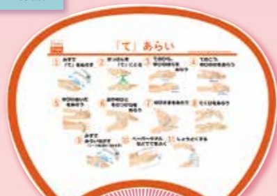
E 手洗い啓発うちわ

寸法 / 34.5cm×24cm 1本に付 96円(税込105.6円) (但し各100本以上)