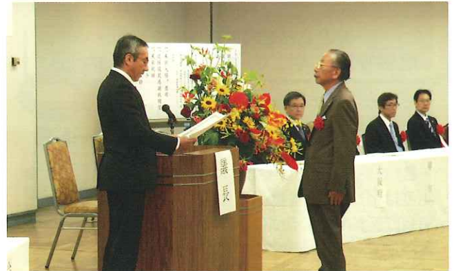
退任役員への感謝状贈呈