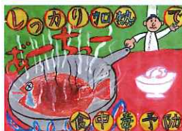
大阪市長賞 北村 優貴