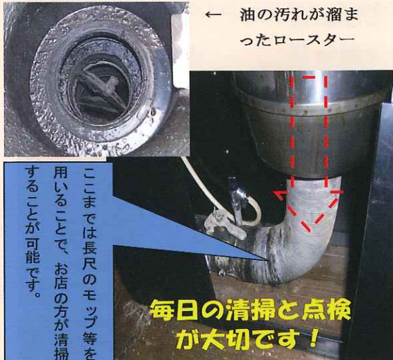
← 油の汚れが溜まったロースター

ロースター周りの日常清掃は行っていたが・・・排気ダクトから出火！という火災が多く発生しています。