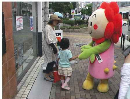
茨木支部(街頭キャンペーン) いばらっきーちゃん<一日食品衛生指導員>