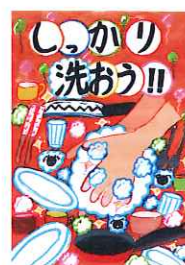
協会長賞 戸屋 友夏