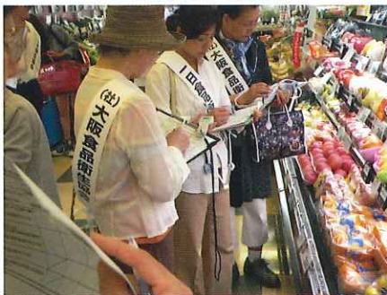
豊中支部(量販店巡回) 一日食品衛生指導員