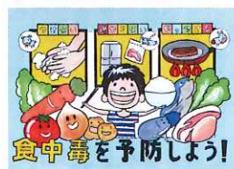
堺市長賞 安宅 大輔