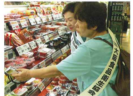
高槻支部(量販店巡回) 一日食品衛生指導員